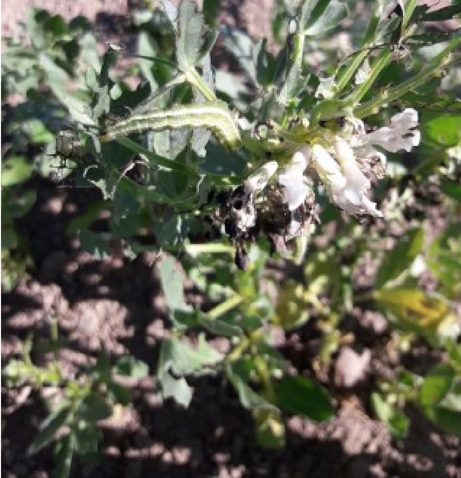
Billede 1. Gammauglelarve i hestebønne fotograferet 25. juni 2018 af Ole Harrild, Bornholms Landbrug.